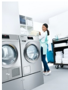
Foto 1: Für gewerbliche Beanspruchungen entwickelt: Die Waschmaschine aus der Baureihe „Performance Plus“ (rechts), die zu der bekannten Serie „Kleine Riesen“ gehört.