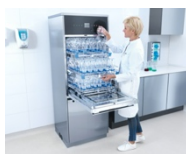
Foto 3: Schmale Masse, maximale Kapazität bei der Beladung: Die freistehenden Miele-Laborspüler der Baureihe SlimLine verfügen über Teleskopauszüge, die eine bestmögliche Ausnutzung des Spülraums ermöglichen.

Foto 2: Die Kammer der Grossraum-Laborspüler PLW 86 weist entweder eine weisse, grüne oder rote Beleuchtung auf. Grün signalisiert Anwendern, dass das Gerät entladen werden kann.